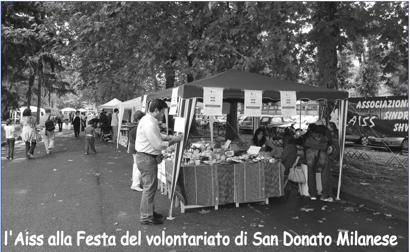
I' Aiss alla Festa del volontariato di San Donato Milanese